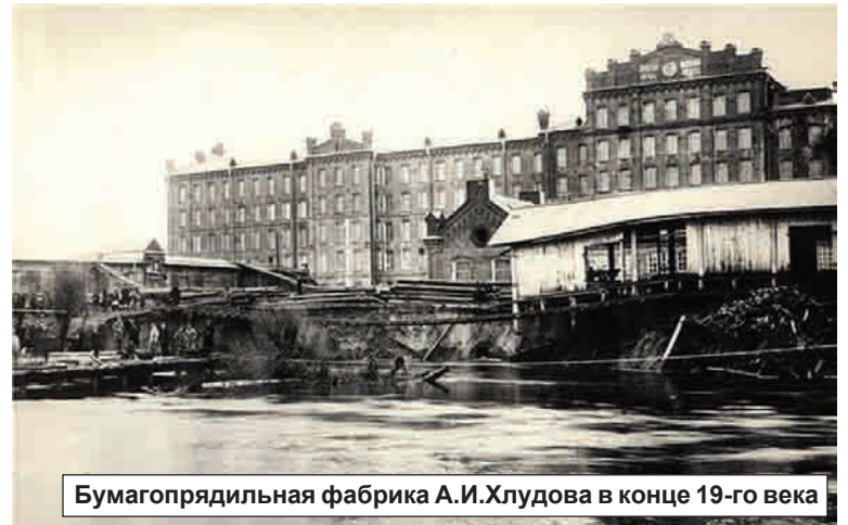
Бумагопрядильная фабрика А.И.Хлудова в конце 19-го века

Но горько и обидно до слез смотреть, до какого печального состояния довели любимое детище Хлудова — хлопчатобумажный комбинат. Алексей Иванович с огромной любовью оборудовал ярцевскую мануфактуру по после-