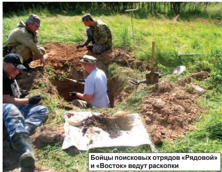
Бойцы поисковых отрядов «Рядовой» и «Восток» ведут раскопки